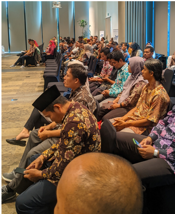
Peserta Pelatihan Dasar Pengelola BUMDes Kabupaten Kudus

Tantangan terbesar yang dihadapi BUMDes di masa depan adalah menjaga keberlanjutan setelah fase pendampingan berakhir. Kemandirian BUMDes kunci utama keberhasilan BUMDes. Tanpa kemandirian, risiko stagnasi BUMDes bahkan kegagalan usaha masih cukup besar. Kolaborasi Perkumpulan Desa Lestari bersama Lokadata dalam program pendampingan sudah selesai tetapi akhir ini menjadi titik awal BUMDes untuk berdiri dan terus berkembang dengan kekuatan sendiri menuju kemandirian dan keberlanjutan. (LA)