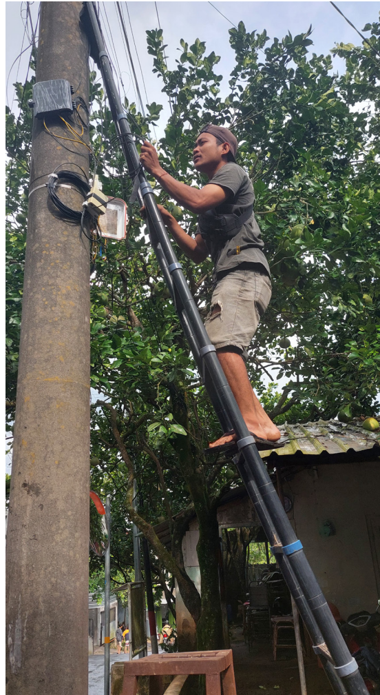
Petugas pengelola sedang memperbaiki infrastruktur jaringan di Desa Japan