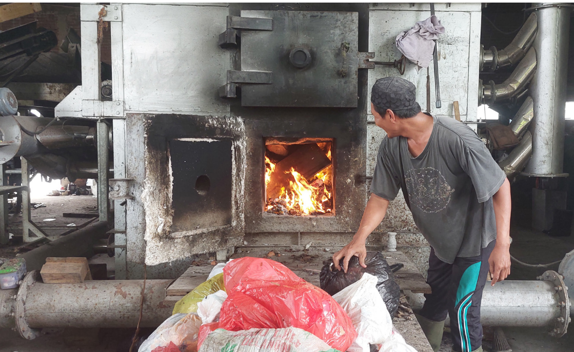
Proses membakar sampah plastik menggunakan insinerator