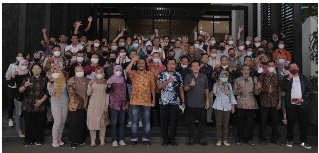
Peserta pelatihan dari 14 desa di Kabupaten Kudus bersama Vice President Djarum Foundation dan para narasumber sesuai Pelatihan Dasar Pengelola BUMDes di Kabupaten Kudus pada 2021