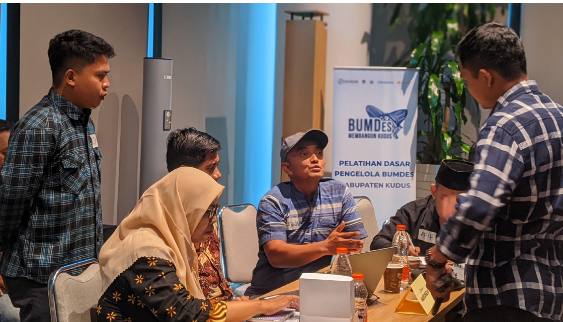
Sesi diskusi saat Pelatihan Dasar Pengelola BUMDes bersama fasilitator

SELAMA enam tahun terakhir, pendampingan Badan Usaha Milik Desa (BUMDes) di Kabupaten Kudus oleh Lokadata yang berkolaborasi dengan Perkumpulan Desa Lestari menunjukkan perjalanan yang panjang dan tidak linier. Pendampingan ini penuh dengan proses pembelajaran yang membentuk fondasi ekonomi desa. Program yang dimulai sejak 2019 ini tidak hanya berorientasi pada pembentukan BUMDes secara administratif, melainkan juga pada penguatan kelembagaan, kapasitas operasional, hingga keberlanjutan usaha berbasis kebutuhan lokal dan potensi desa.