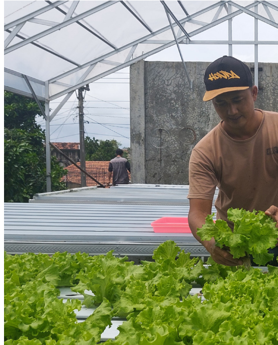
Pengurus BUMDes Manggala Karya Desa Cendono A

BUMDes Manggala Karya memilih komoditas jamur tiram dan selada hidroponik. Selain budidayanya relatif mudah, kedua komoditas tersebut memiliki siklus panen cepat dan tidak membutuhkan lahan luas. Namun, proses merintis usaha ini tidak berjalan mulus. Keterbatasan sumber daya manusia dan kualitas media tanam menjadi kendala utama yang berdampak pada hasil panen yang belum optimal pada tahap