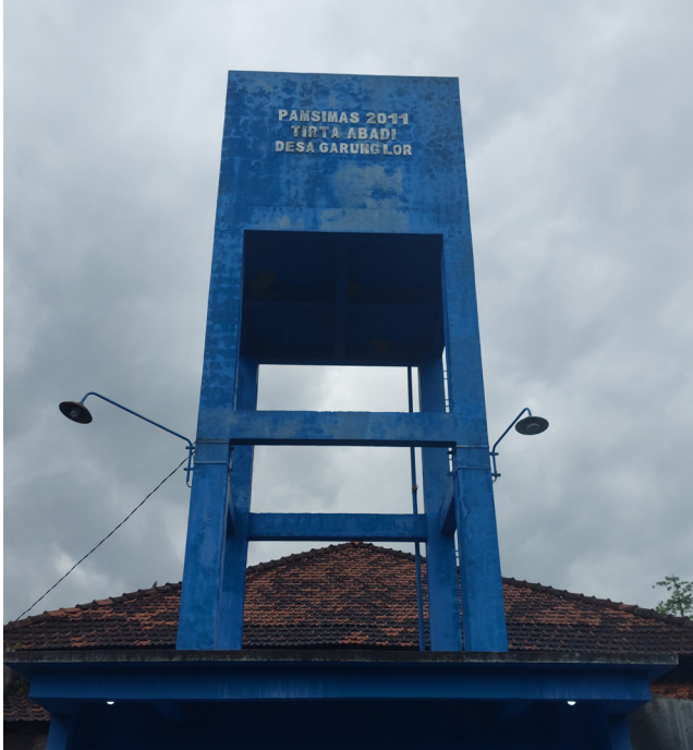
Gardu PAMSIMAS Desa Garung Lor