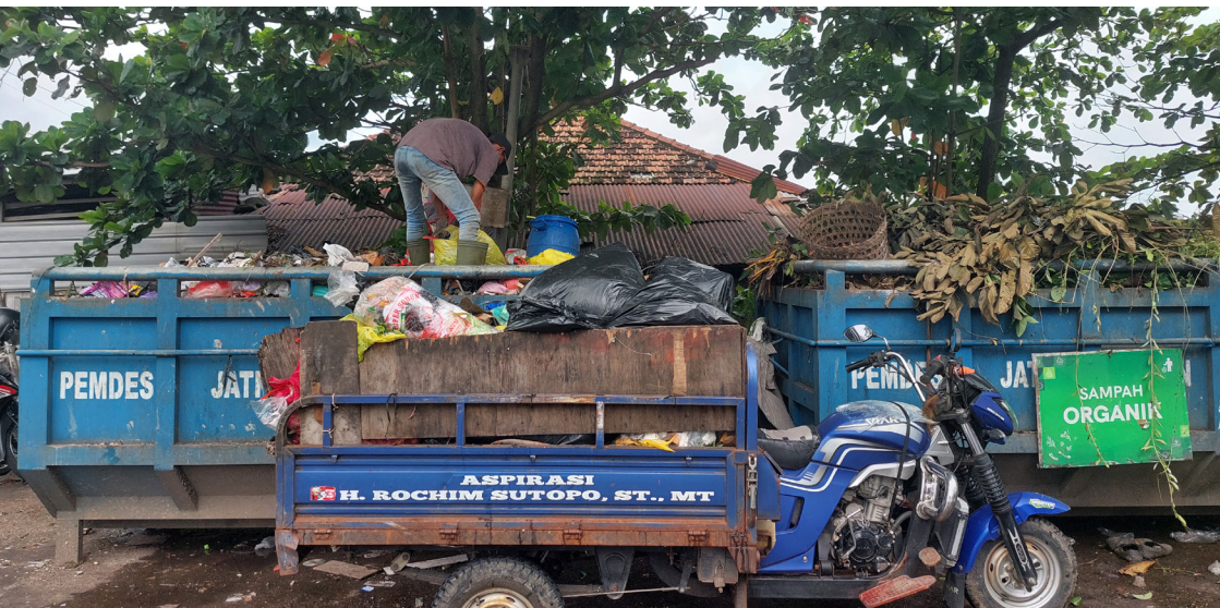
Kendaraan pengangkut sampah Desa Jati Kulon