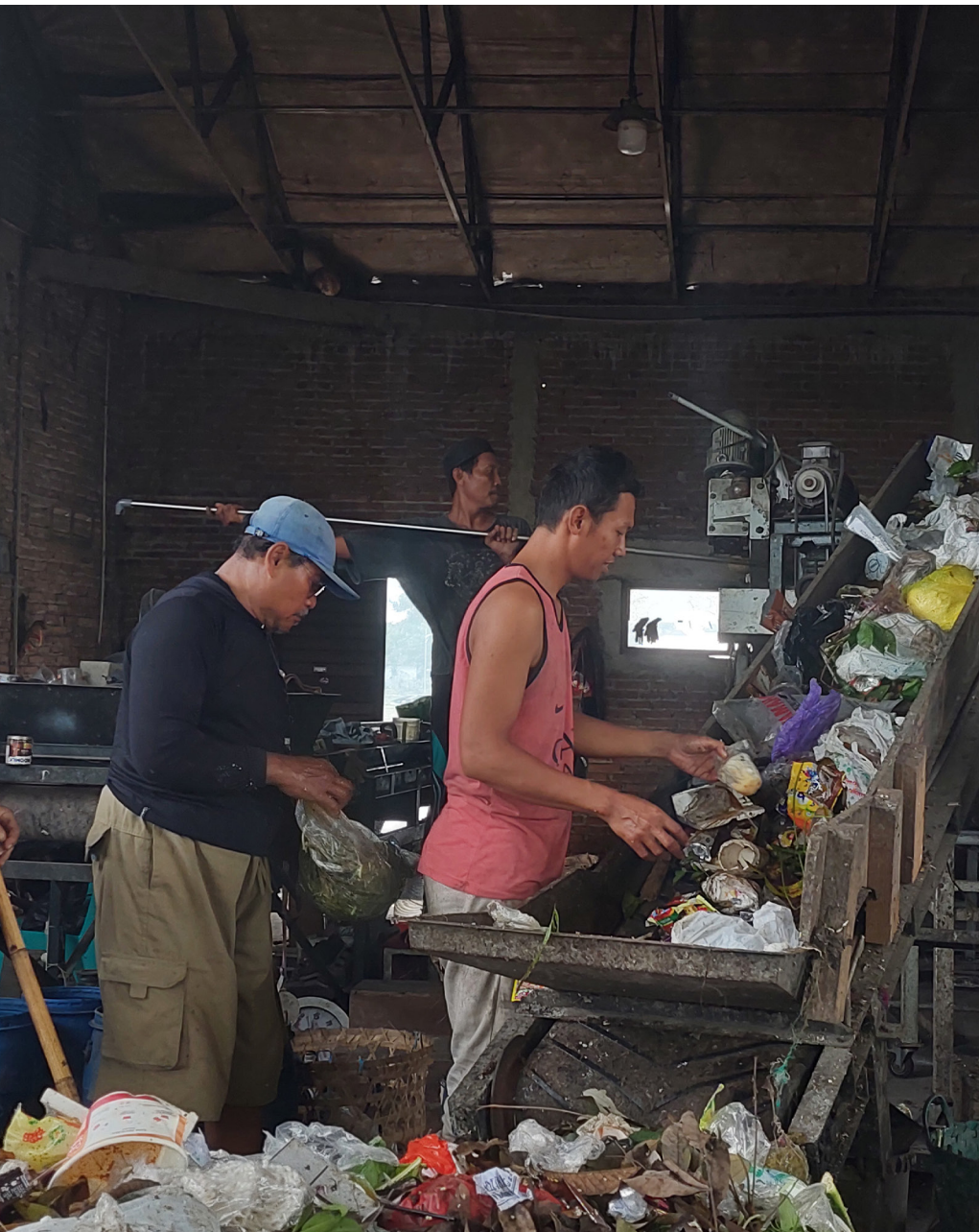
Petugas TPS3R Jati Kulon sedang mengolah sampah plastik