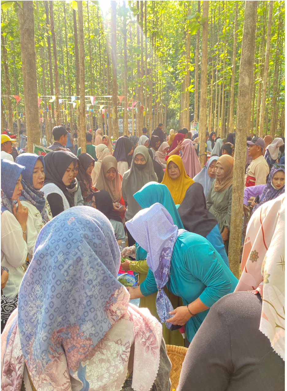
Masyarakat memadati salah satu pedagang jajanan di Pasar Sarwono